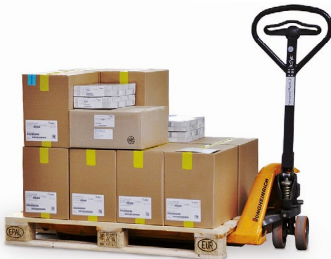
Fertiges Mehrkomponenten-KIT Finished multi-component KIT

An important component of our Pharma Supply Chain management is the so-called KIT system. This means that we produce folding cartons, leaflets and adhesive labels and deliver these just in time directly to the packaging line and specific to the order.